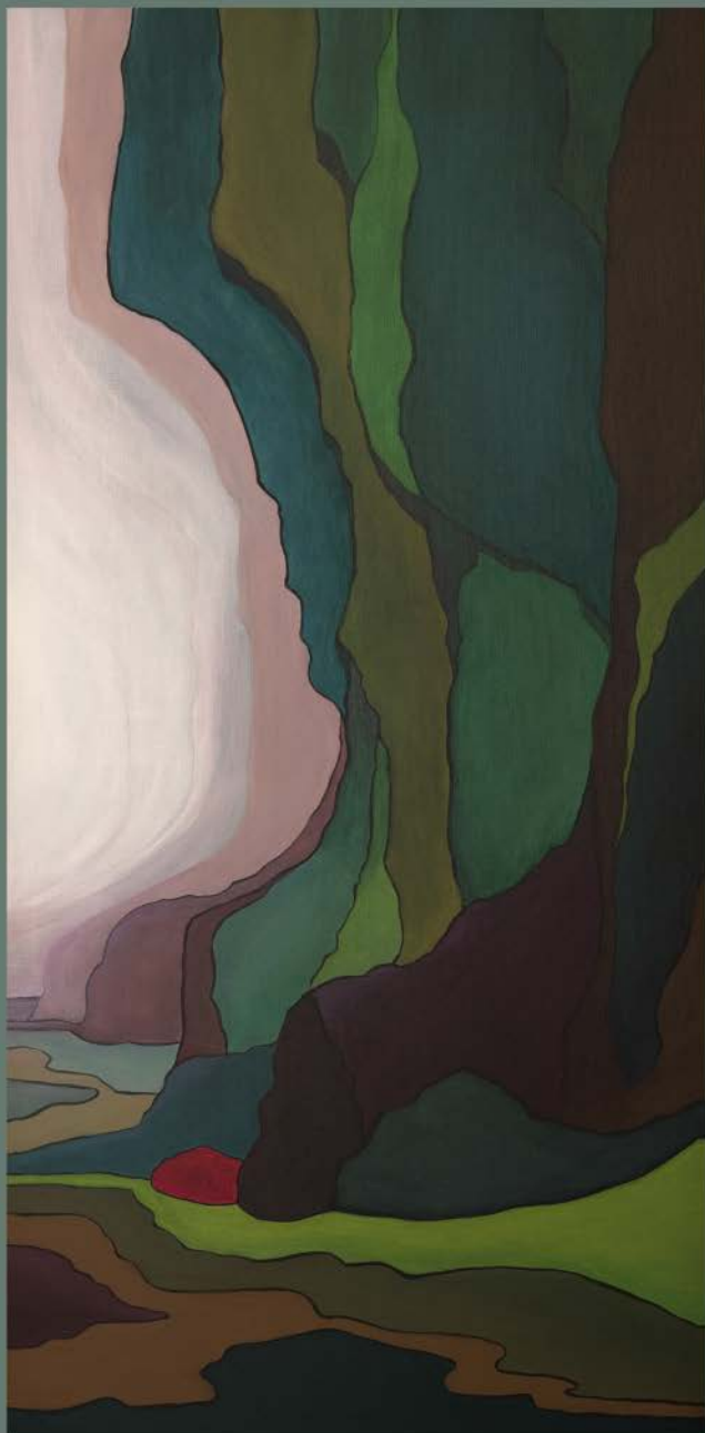
ISLANDIA N° 6 akryl, płótno, 100 x 50 2021