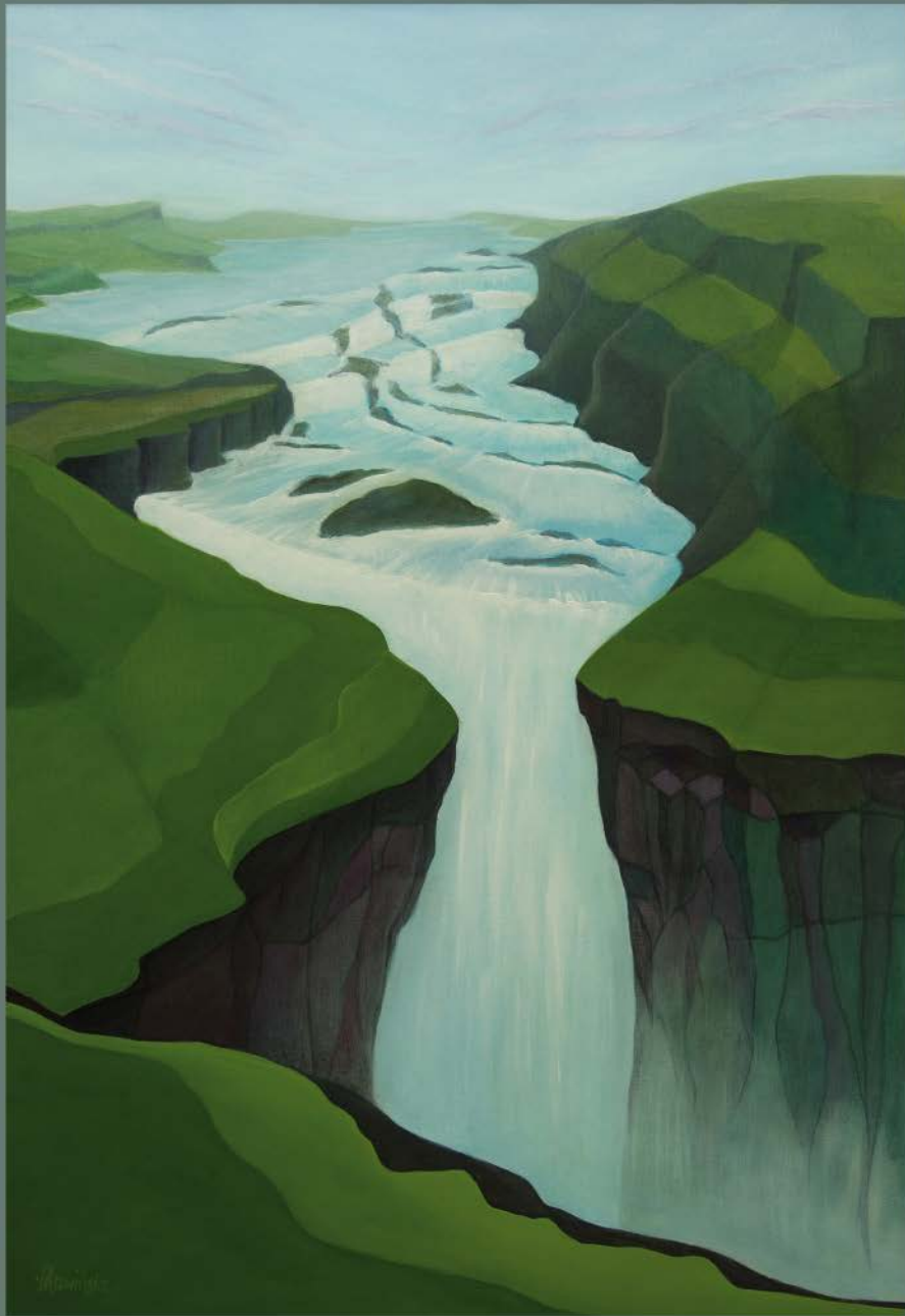
ISLANDIA Nº 11 akryl, płótno, 100 x 70 2022