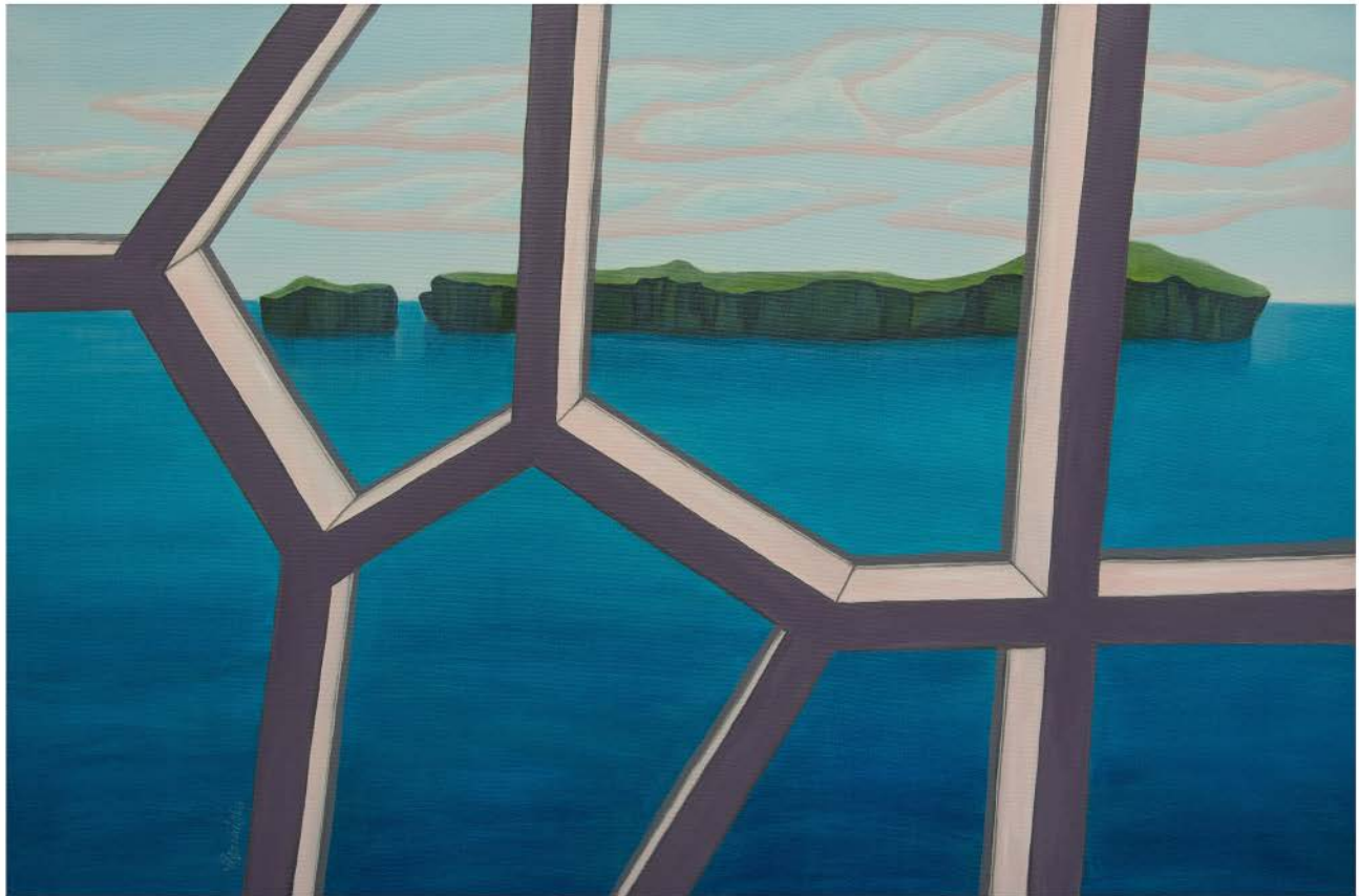
ISLANDIA Nº 14 akryl, płótno, 60 x 90 2022