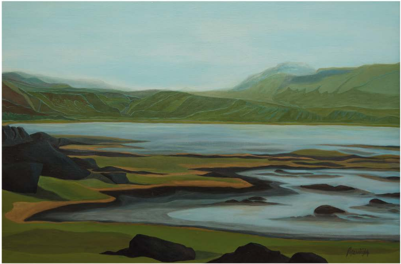
ISLANDIA Nº 2 akryl, płótno, 60 x 90 2019