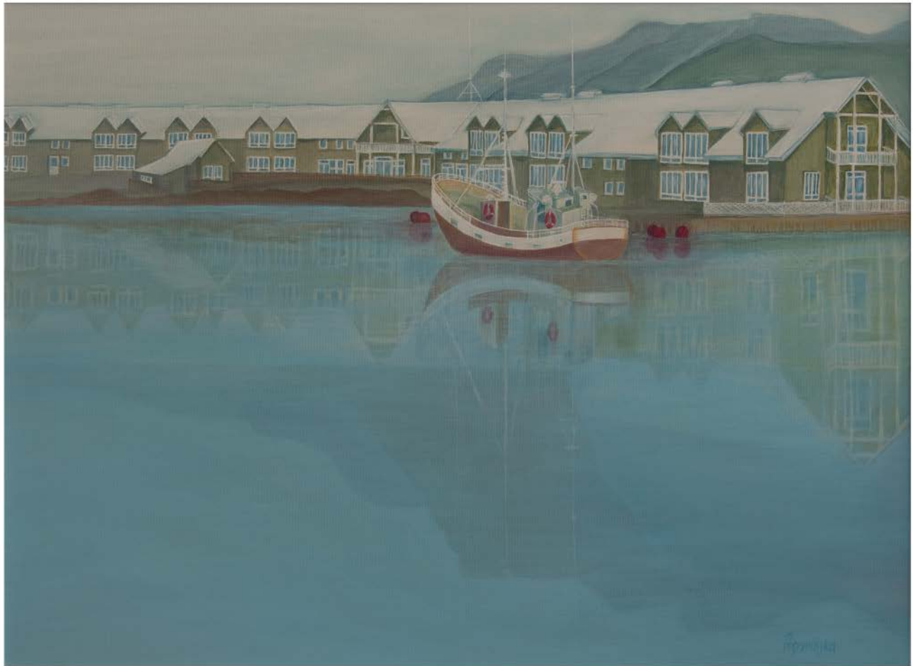
ISLANDIA Nº 9 akryl, płótno, 60 x 80 2022