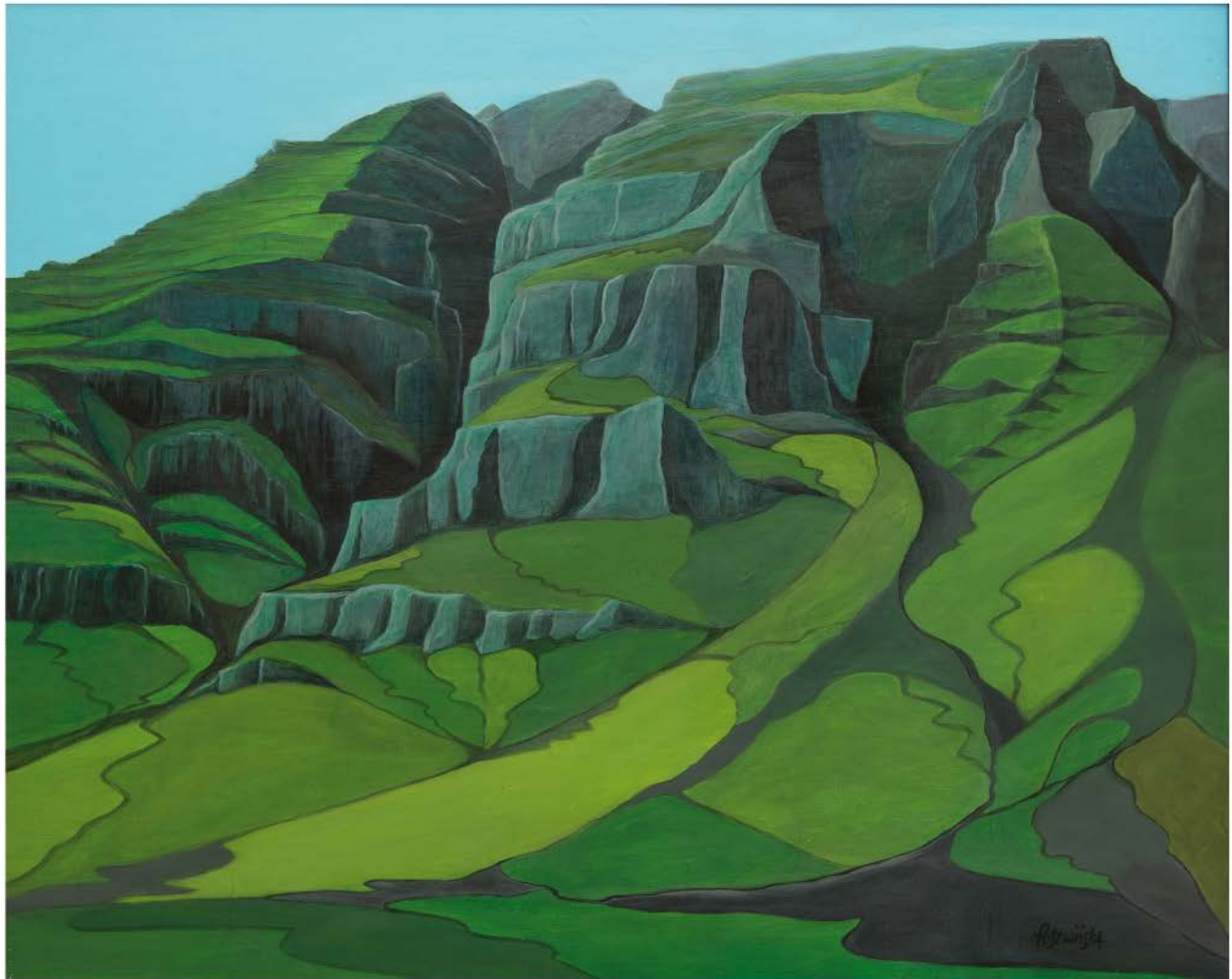
ISLANDIA Nº 7 akryl, płótno, 65 x 81 2020