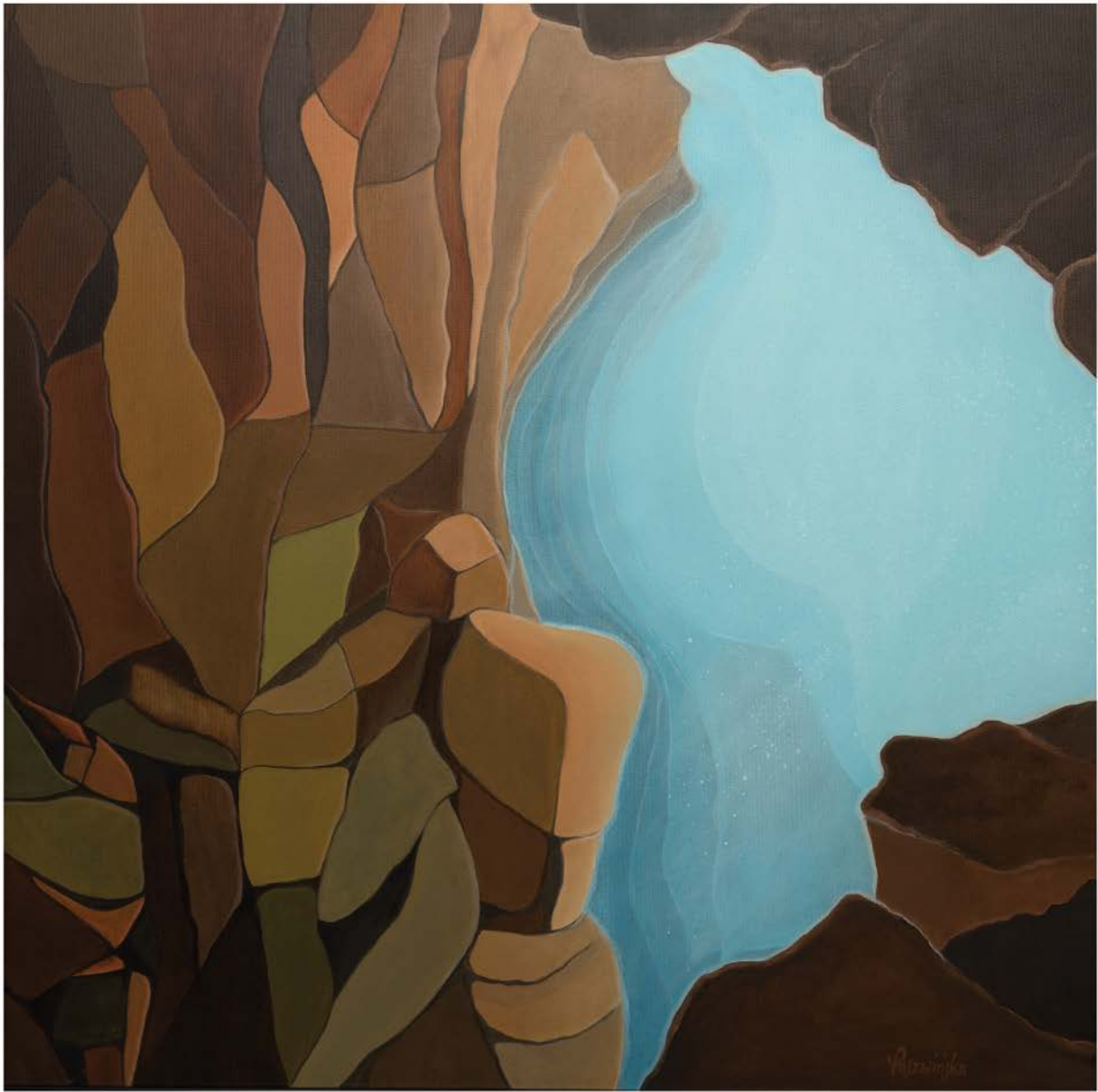
ISLANDIA Nº 16 akryl, płótno, 80 x 80 2022