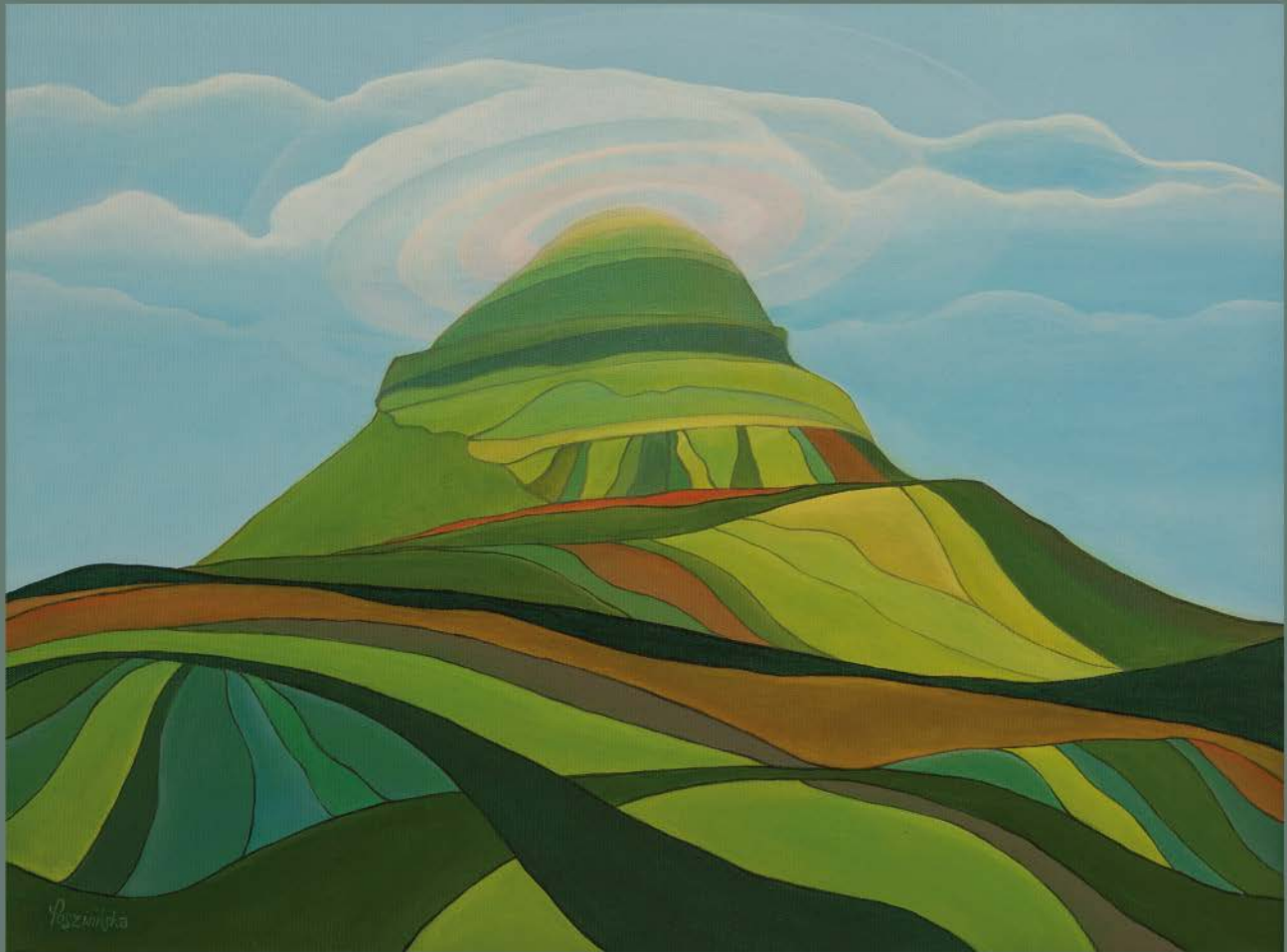
ISLANDIA Nº 13 akryl, płótno, 60 x 80 2022