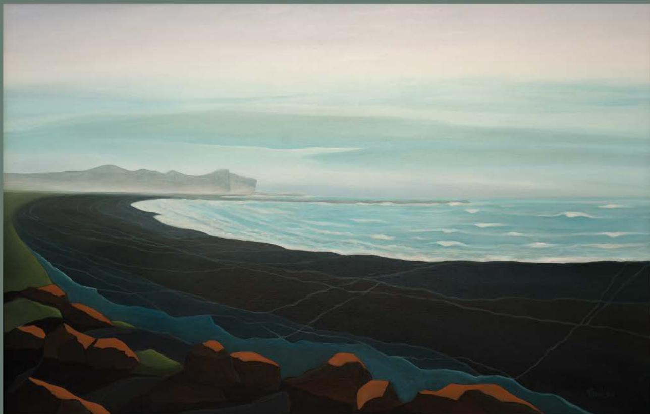
ISLANDIA Nº 17 akryl, płótno, 90 x 140 2022