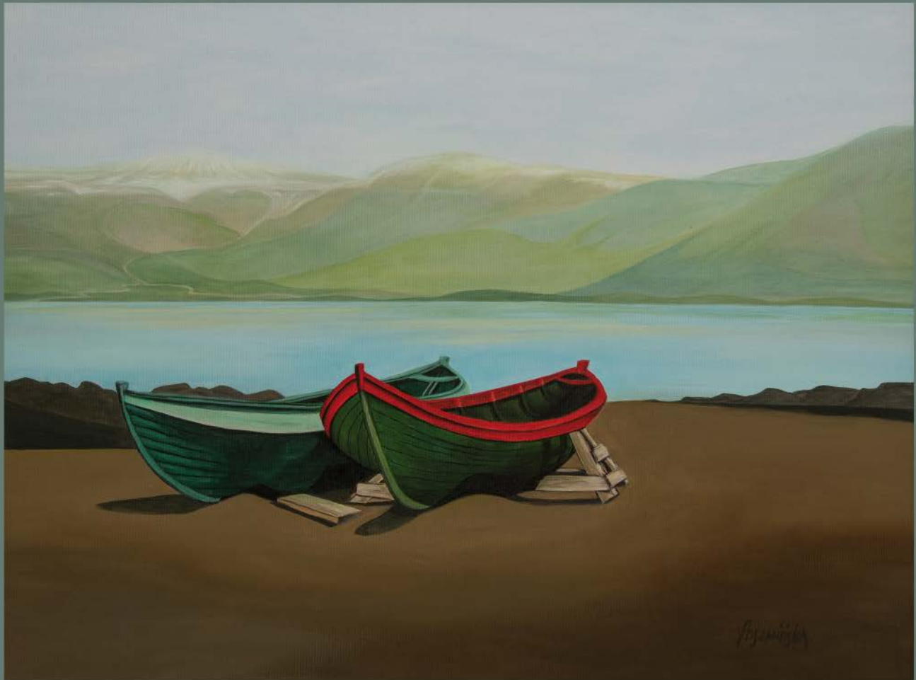
ISLANDIA Nº 3 akryl, płótno, 60 x 80 2019