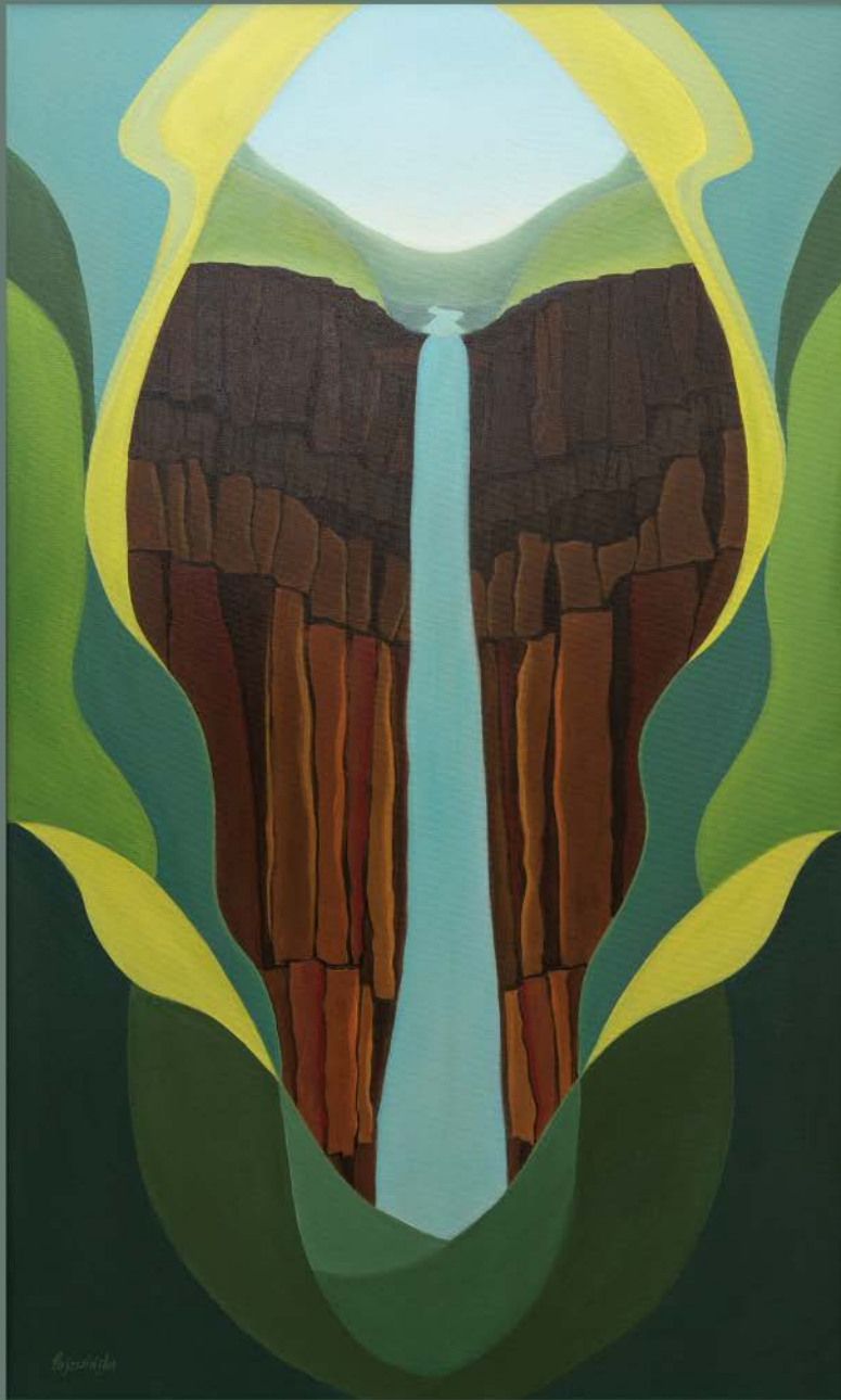
ISLANDIA N° 8 akryl, płótno, 100 x 60 2022