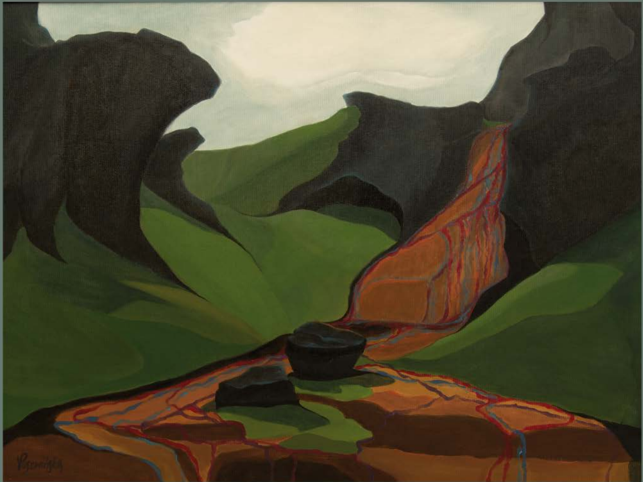
ISLANDIA Nº 4 akryl, płótno, 60 x 80 2020