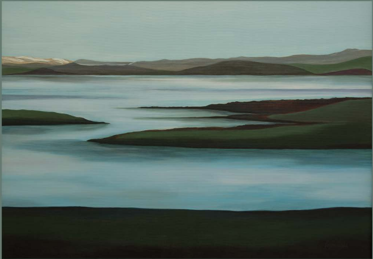
ISLANDIA Nº 5 akryl, płótno, 70 x 100 2021