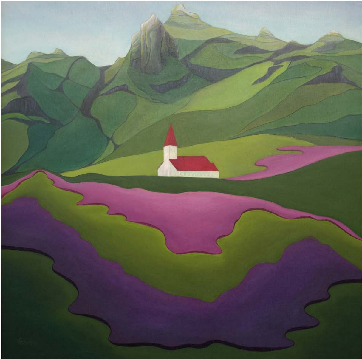
ISLANDIA Nº 9 akryl, płótno, 100 x 100 2022