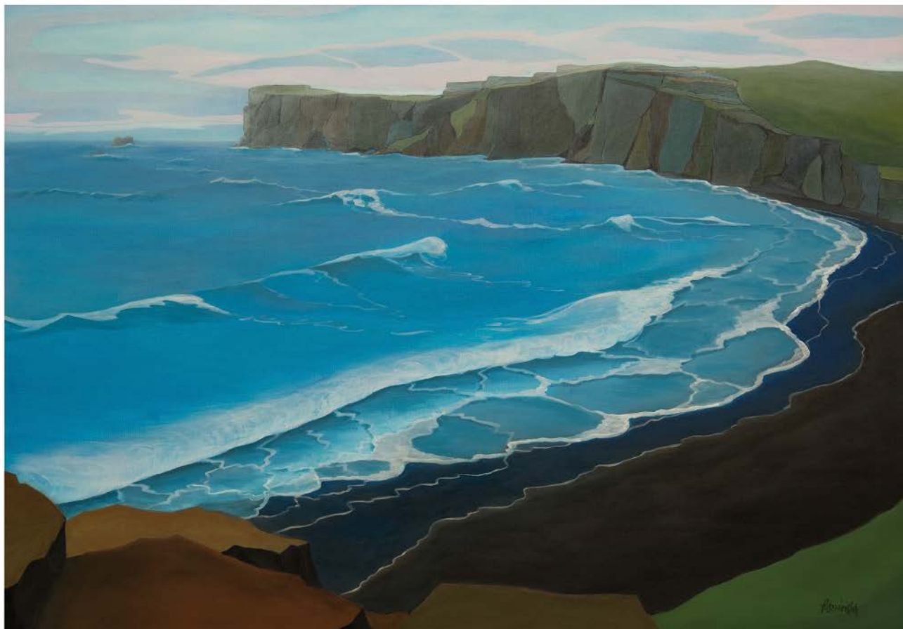
ISLANDIA Nº 10 akryl, płótno, 90 x 120 2021