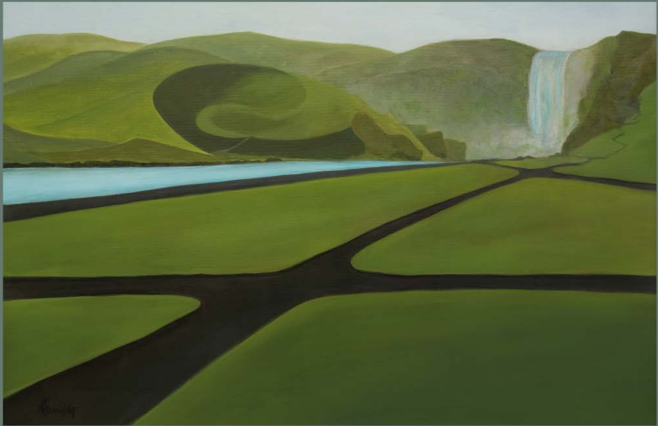
ISLANDIA Nº 1 akryl, płótno, 60 x 90 2019